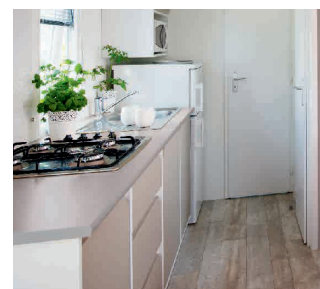
Réfrigérateur-congélateur en option