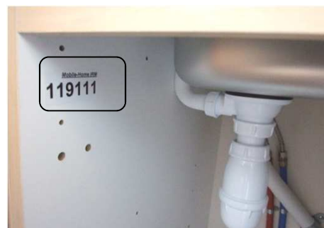
Mobil-home IRM 119 111 = Gamme 2009