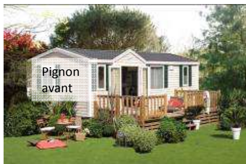
La façade du mobil-home face à vous, le pignon avant est situé sur la gauche.